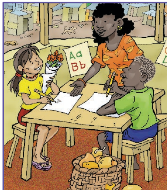
Ilustración de Olman Bolaños Vargas; DNI-Costa Rica.