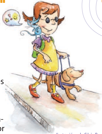
Ilustración de Silvia Ramos Solís; DNI-Costa Rica.

Con el fin de implementar las publicaciones de DNI; Educación Inclusiva y Trabajo Infantil y Adolescente y el libro de acompañamiento escolar para los maestros, DNI Ecuador decidió no solo trabajar en un circuito diferente de escuelas, sino también adaptar estos